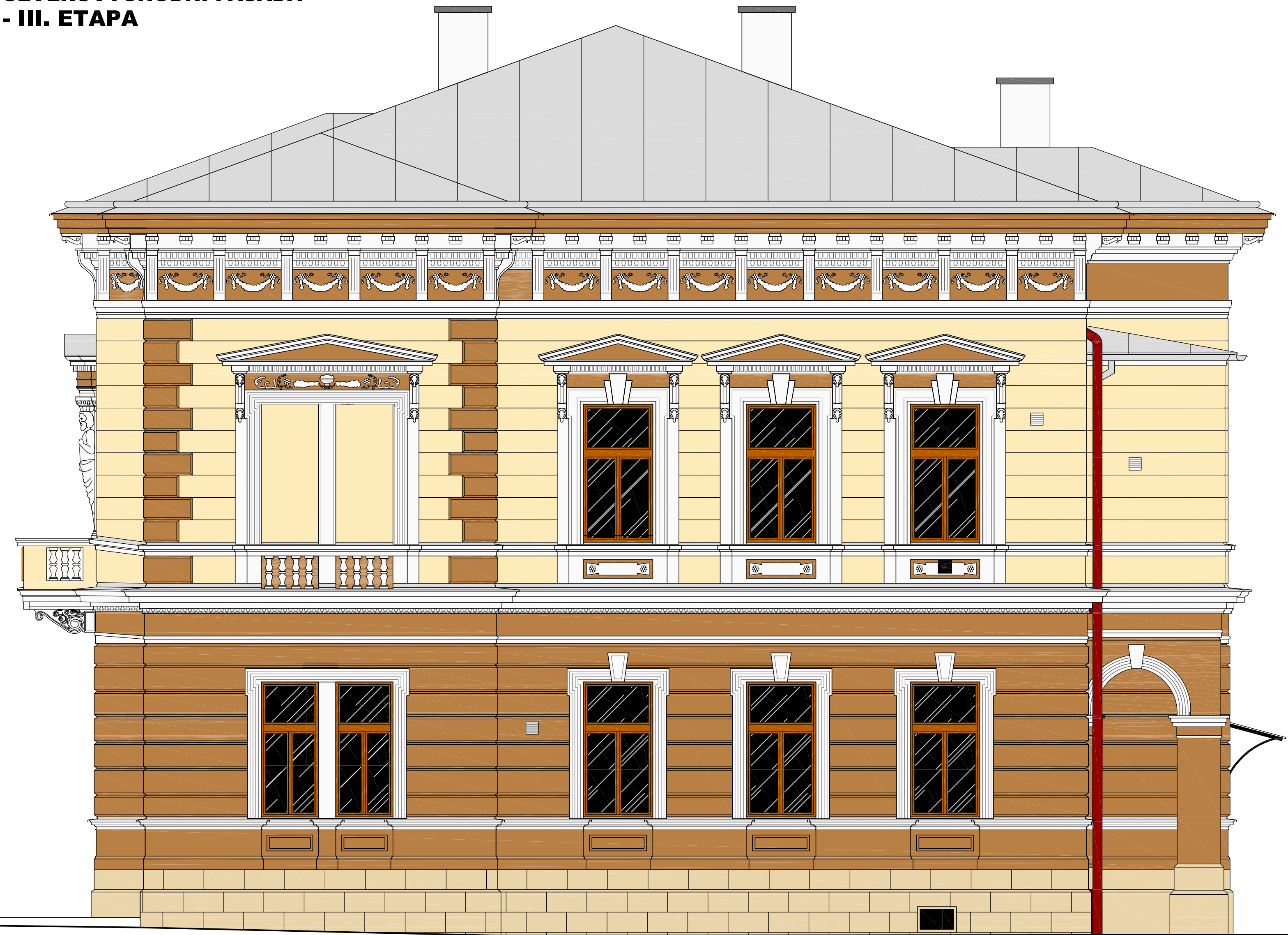
SEVEROVÝCHODNÍ FASÁDA - III. ETAPA